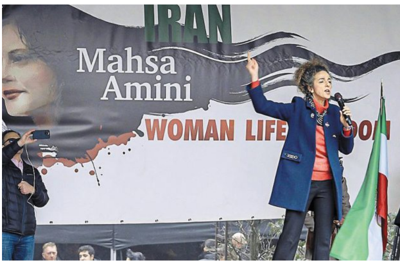
Masih Alinejad, journaliste et activiste iranienne, lors d'une prise de parole en soutien à Mahsa Amini, à Bruxelles.

« Femme, vie, liberté », « Honte à vous » : très vite, les cris de ralliements sont repris par les femmes comme les hommes, et s'étendent aux trente et une provinces du pays.